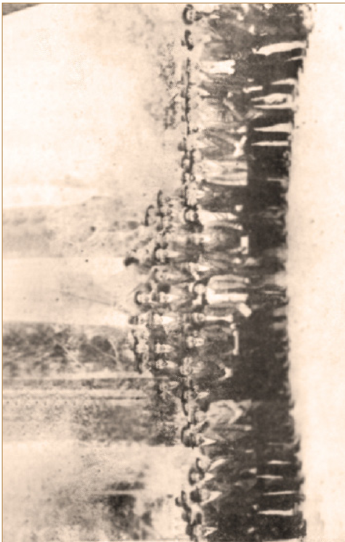
Federación Obrera Internacional, mitín del Primero de Mayo