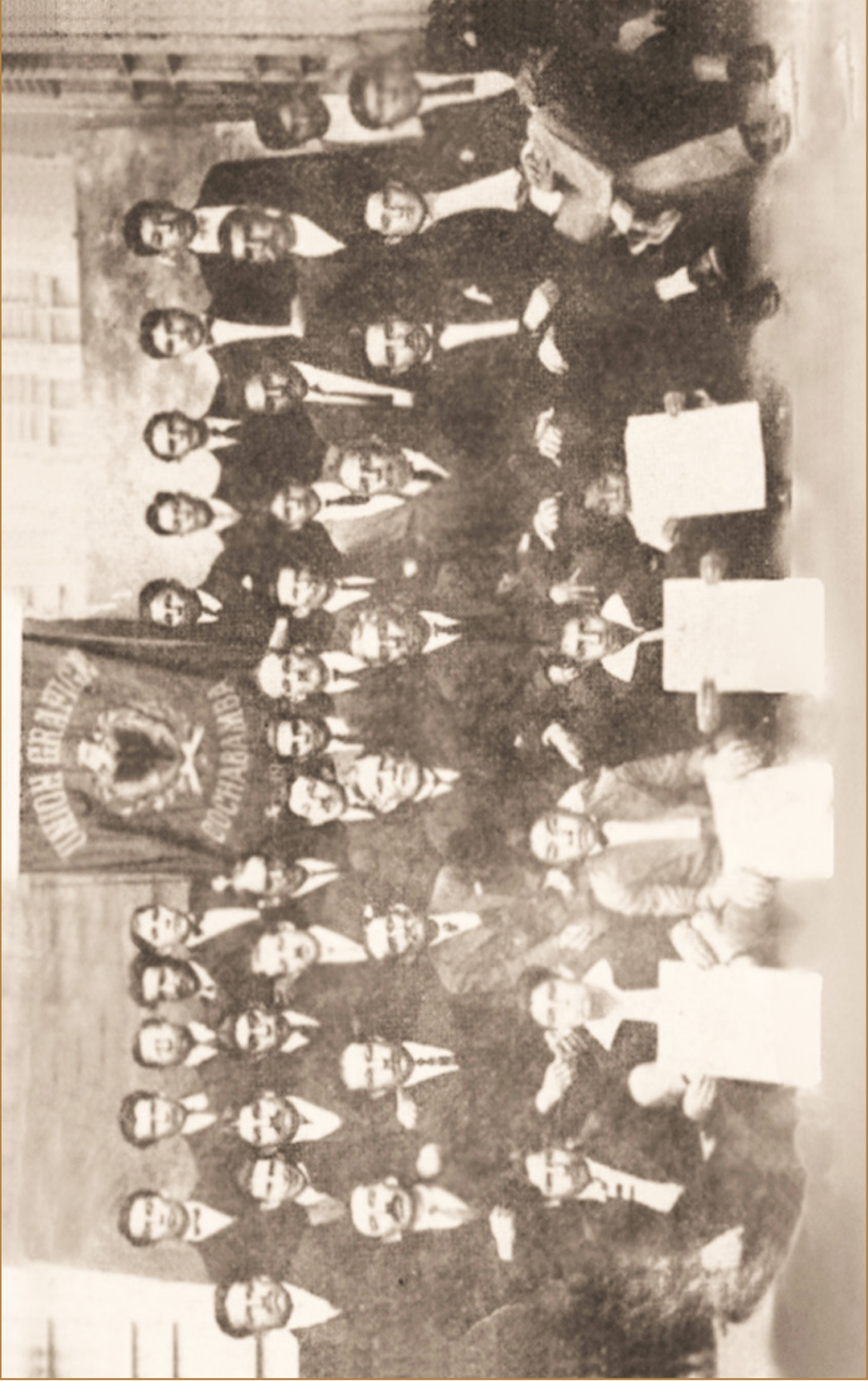
Unión Gráfica de Cochabamba. Directorio y miembros