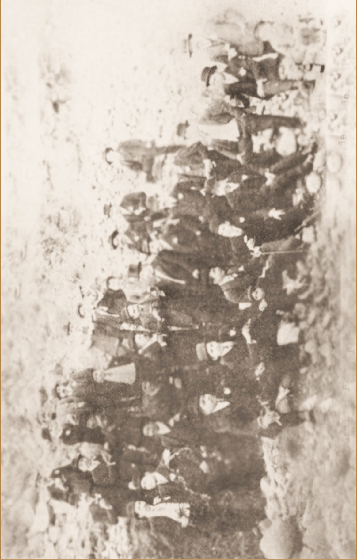
Obreros liberales potosinos son agasajados por sus compañeros de La Paz antes de 1914