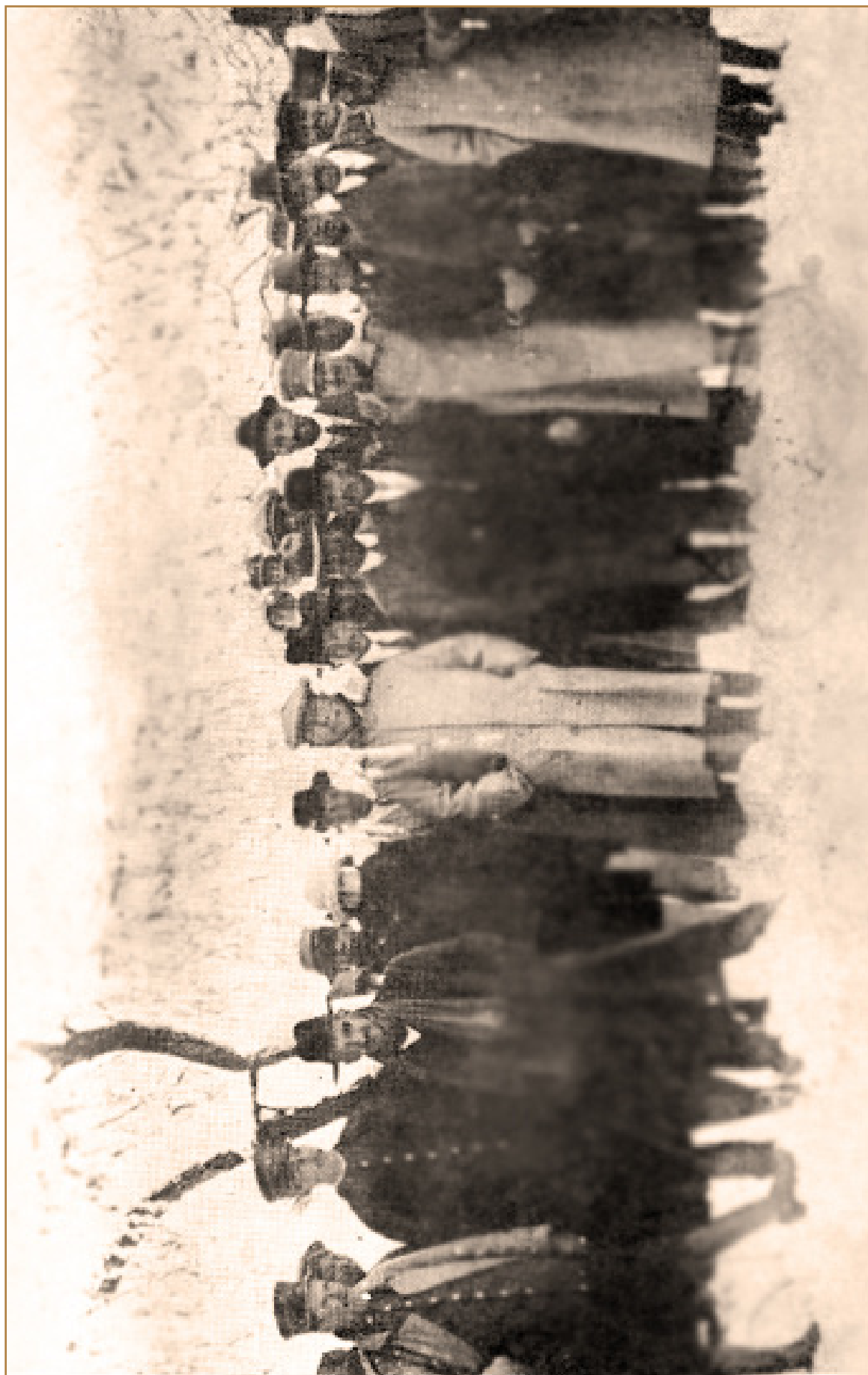
Empleados de la Patiño en la Salvador, en la época de la lucha con la Liallagua